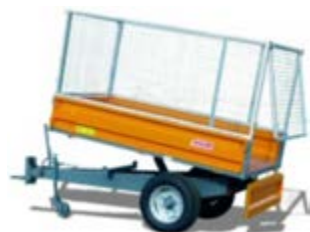
RMTB2225 (met neerklapbare schotten en gras-/bladschotten)

Gras-/bladschotten 1 m hoog RMBT2225 € 1.500,00