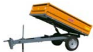
RMTB1020 (met neerklapbare schotten)

De Majar kippers zijn zeer compact en robuust gebouwd en speciaal ontworpen voor het gebruik achter compacttractoren.